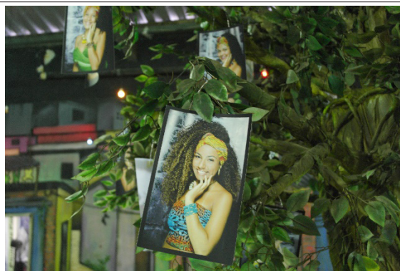
Figura 3. Feria Cultural ADN África