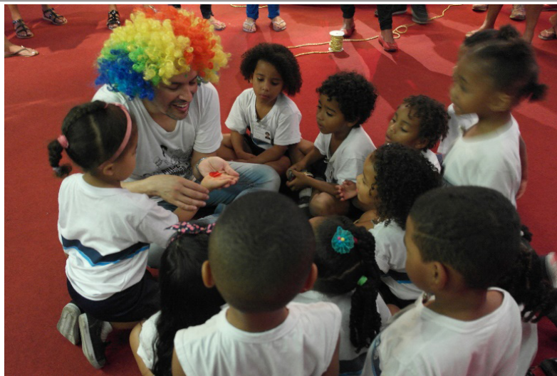
Figura 2. Metáfora de la mariposa viva