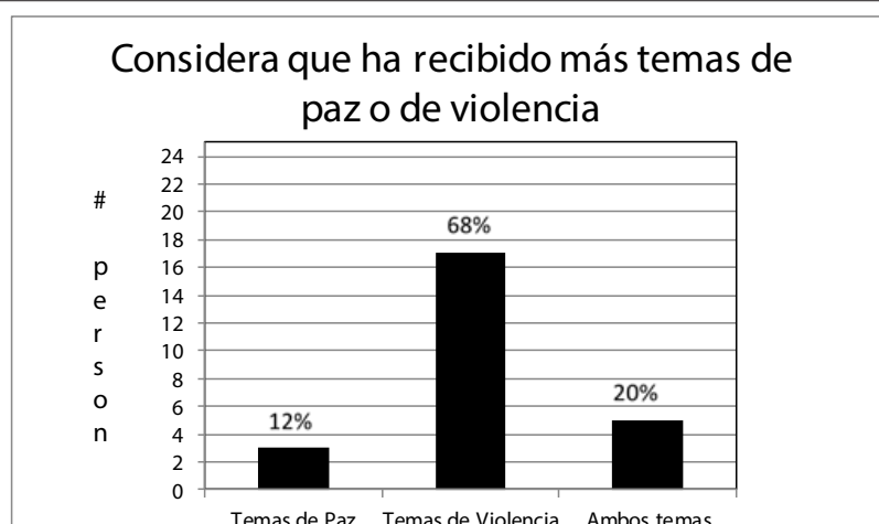
Figura 2: Paz o violencia